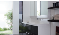
収納たっぷりの洗面台