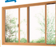
商品画像はイメージです。

工事総額 300,000円 (内窓本体・取替工事・廃棄費用の目安、消費税込)を想定、オールLIXIL 無金利リフォームローンキャンペーン適用、頭金0円、割賦元金 300,000円、60回均等払いを想定した試算金額となります。実際の金額とは異なりますので、詳細につきましてはお尋ねください。