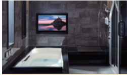
ゆったりできる浴室