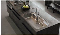
調理が楽しいキッチン

月々 29,000円 ~ (工事総額 300万円、頭金126万円を想定) 商品画像はイメージです。